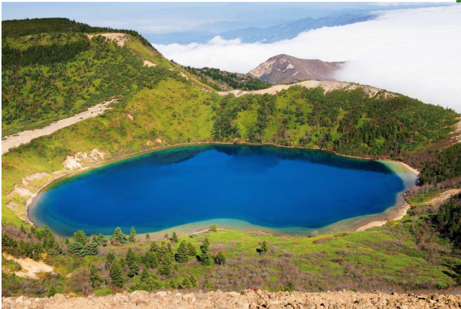
福島県福島市 魔女の瞳（五色沼）